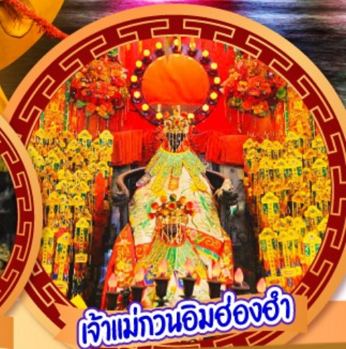
เจ้าแม่กวนอิมฮ่องฮ่า

นมัสการเจ้าแม่กวนอิมฮ่องฮ่า หมุนกังหันรับโชคลาภเงินทองที่วัดแชงหมิว ขอพรความรักกับผู้เฒ่าจันทรธา วัดหวังต้าเซียน