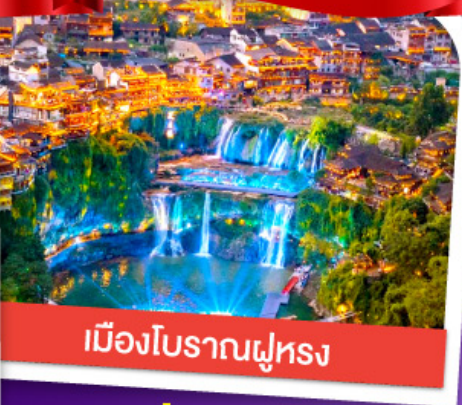
เมืองโบราณฟูหลง