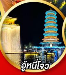
อู่หนี่โจว