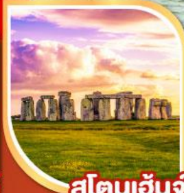
สโตนเฮนจ์