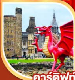
คาร์ดิฟฟ์