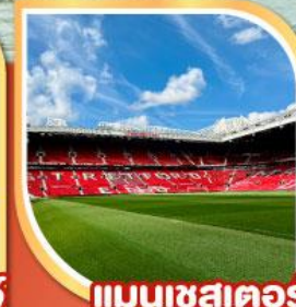
แมนเชสเตอร์

19-26 ธ.ค.67 | 26 ธ.ค.-02 ม.ค.68 23-30 ม.ค.68 | 20-27 ก.พ.68 06-13 มี.ค.68 | 20-27 มี.ค.68