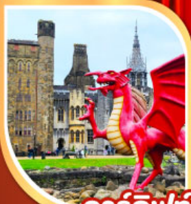
คาร์ดิฟฟ์