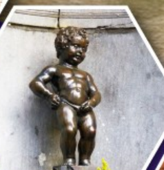
แมนเกินฟิส