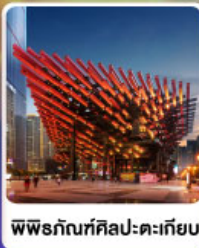
พิพิธภัณฑ์ศิลปะตะเกียบ