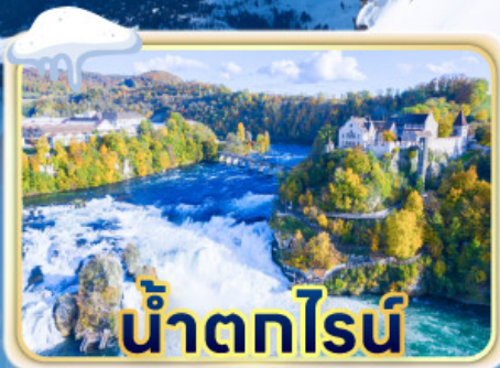
น้ำตกไรน์