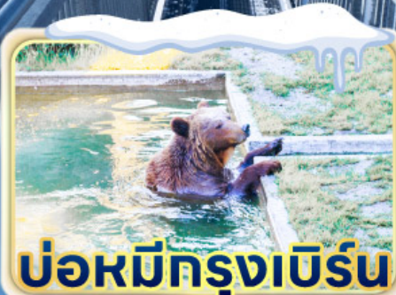
บ่อหมีกรุงเบิร์น