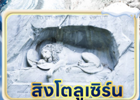
สิงโตลูเซิร์น