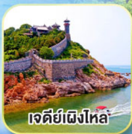
เจดีย์เฝิงโหล