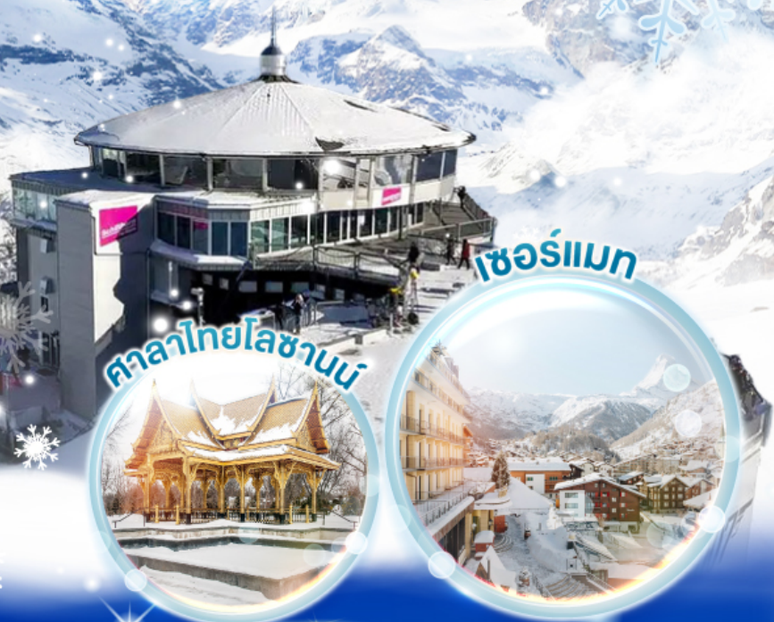
ศาลาไทยไลซานน์