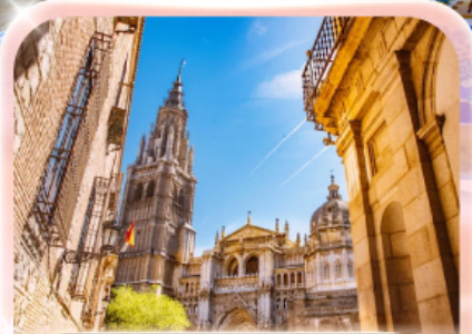
มหาวิหารแห่งโกเธอด