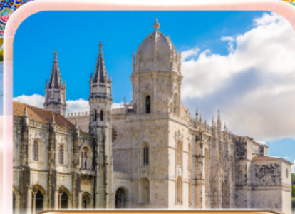
มหาวิหารเจอโร นีโม