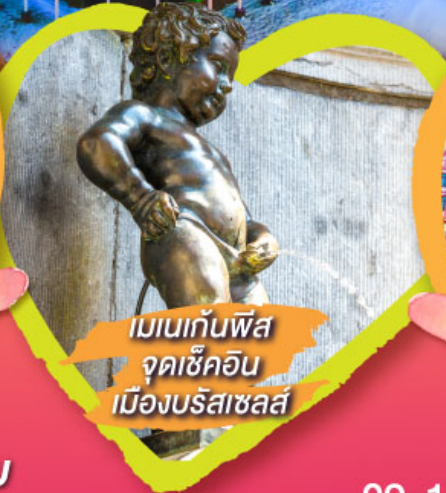
เมเนกันพิส จุดเช็คอิน เมืองบรัสเซลส์