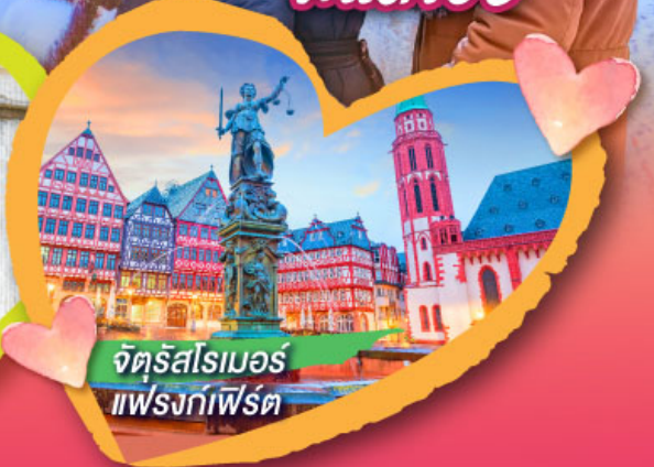
จัตุรัสโรเมอร์ แฟรงก์เฟิร์ต