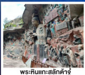
พระหินแกะสลักตัวจู้