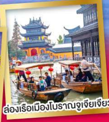
ล่องเรือเมืองโบราณจูเจียเจียว