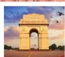
♡♡♡ India Gate