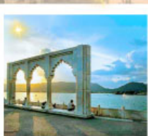
Ana Sagar Lake