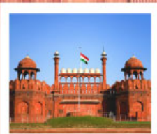
♡♡♡ Agra Fort