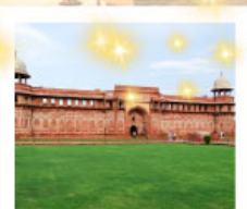
Ajmer Sharif Dargah