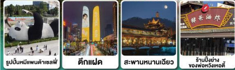
รูปปั้นหมีแพนด้าเซลฟ์ • ดิ็กแฝด • สะพานหนานเฉียว • ร้านปิ้งย่างของพ่อหวังหอดี้

แวะชิมปิ้งย่างหม่าล่า ร้านคุณพ่อ (แว้งแอดตี้) ที่เมืองเล่อซาน