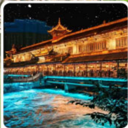
Blue Tears สะพานหนานเฉียว