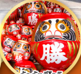
วัดคิตสึโองิ (วัดดามะ)

ชมความงามของกำแพงหิมะ เส้นทางสายอัลไพน์ ทากายามา (JAPAN ALPS SNOW WALL)