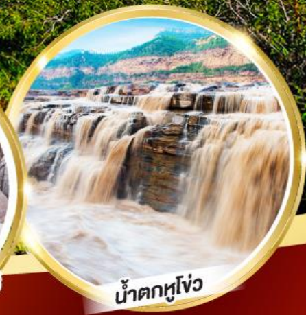
น้ำตกหูโง่