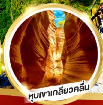
หุบเขาเกลียวคลื่น