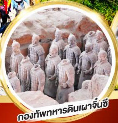
กองทัพทหารดินเผาจีนซี