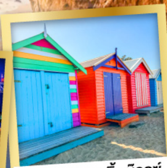
ไบรด์ตัน บาร์ตัง บ็อกซ์

03-10, 12-19 เม.ย.68 24 เม.ย.-01 พ.ค.68 08-15, 22-29 พ.ค.68 29 พ.ค.-05 มิ.ย.68