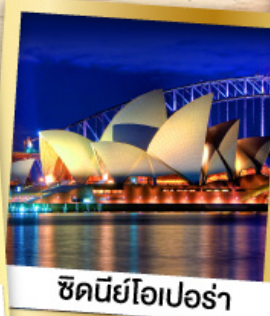
ซิดนีย์โอเปร่า