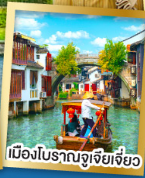
เมืองโบราณจู่เจียเจี้ยว