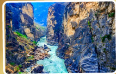
ช่องแคบเลือกระโจน