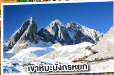
เขาสหิมะมังกรหยก