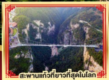
สะพานแกว้ที่ยาวที่สุดในโลก

เขาวงกต เกียนเหมินซาน สองเมืองโบราณ ฟูหลงเจิน เฟิ่งหวง