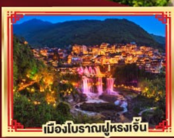
เมืองโบราณฟูหลงเจิน