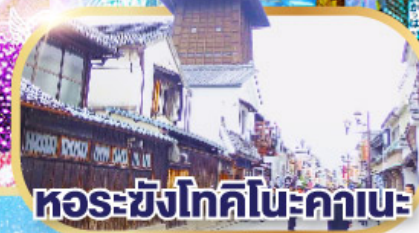
หอรซังโทคิโนะคานะ