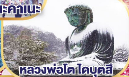
หลวงพ่อดอโดบุตสึ