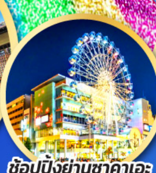
ช้อปปิ้งย่านซากาเอะ