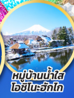
หมู่บ้านน้ำใส ไอชิโนะอัทสึ