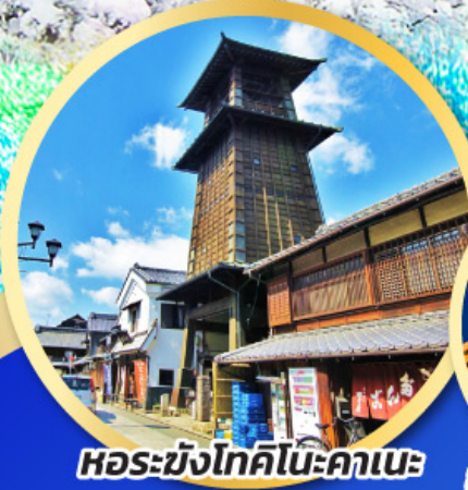
หอรบั้งโทคิโนะคาเนะ