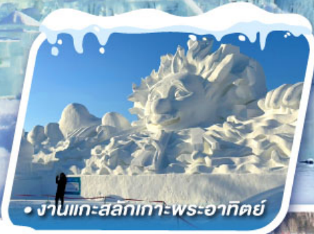
• งานแกะสลักเทวพระอาทิตย์

เที่ยวหมู่บ้านหิมะ ดินแดนหิมะอันสุดประทับใจ