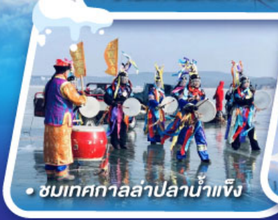
• ชมเทศกาลล่าปลาน้ำแข็ง