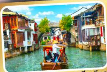
ล่องเรือเมืองโบราณซูเจียเจียว