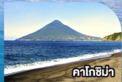
คาโกชิม่า