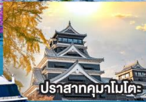
ปราสาทคุมาโมโตะ