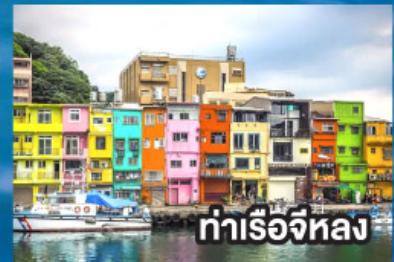
ท่าเรือจีหลง