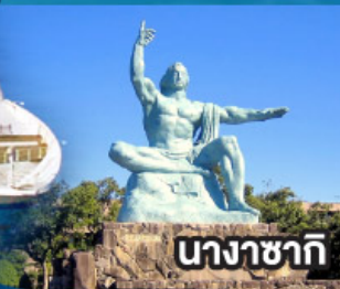
นางาซากิ