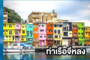
ท่าเรือหลง