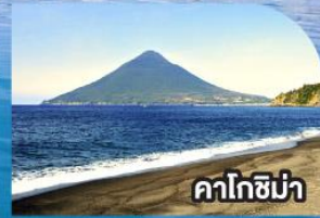
คาโกชิมา