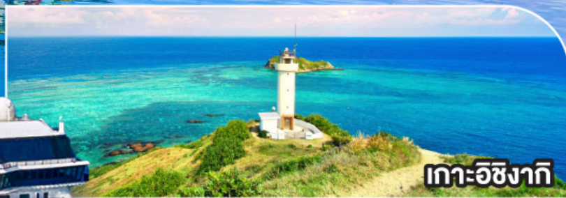
เกาะอิซิงากิ