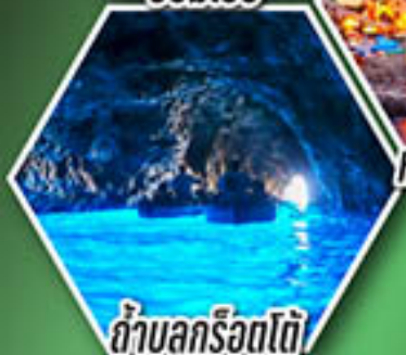
ถ้ำลูกรोटโต้