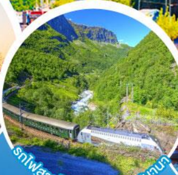
รถไฟสายโรเมนติกฟลัมสบานา