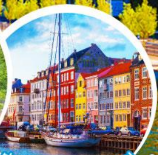
ท่าเรืออ่าววัน.โตเปนฮากน