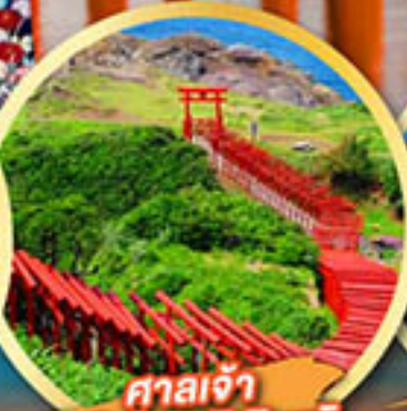
ศาลเจ้า ไมโดโนะซุมิ อินาริ