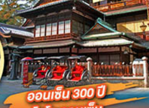
ออนเซ็น 300 ปี โดโจ-ออนเซ็น