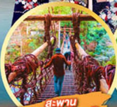
สะพาน อียะโนคะชิระบะชิ