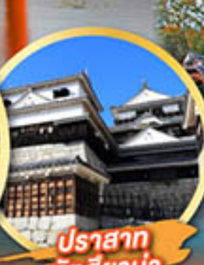
ปราสาท มัตสึยาม่า