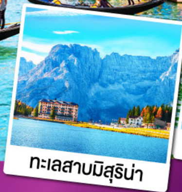
ทะเลสาบมิสุรีน่า