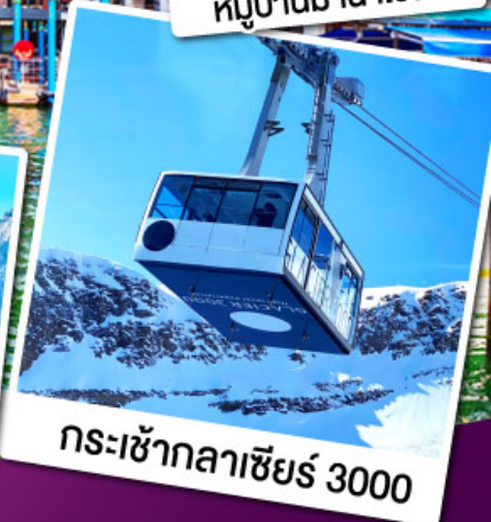
กระเช้ากลาเซียร์ 3000