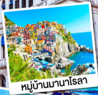
หมู่บ้านมานาโรลา

เที่ยวเก็บครบไฮไลต์โดโลไมท์ ทั้งทะเลสาบมิสุรีน่า