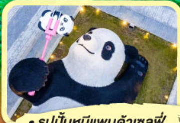
• รูปปั้นหมีแพนด้าเซลฟี