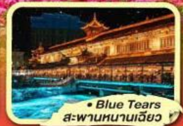
• Blue Tears สะพานหนานเฉียว

★ ไม่ลงร้านช้อปปิ้ง ★ พัก 4 ดาว ★ ชมโชว์ทีเบต