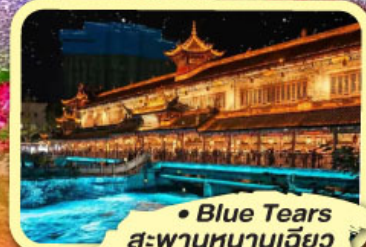
• Blue Tears สะพานหนานเฉียว

★ ไม่ลงร้านช้อปปิ้ง ★ พัก 4 ดาว ★ ชมโชว์ทิเบต