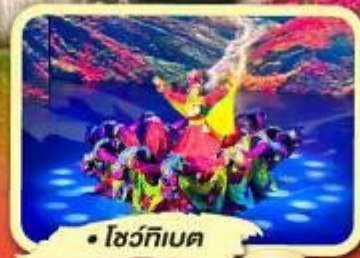
• โชว์ทีเบต