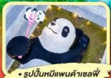
• รูปปั้นหมีแพนด้าเซลฟี่