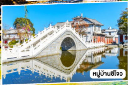
หมู่บ้านซีโจว