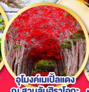
อุโมงค์ไม้แป้นแดง ณ สวนลับฮิราโอกะ