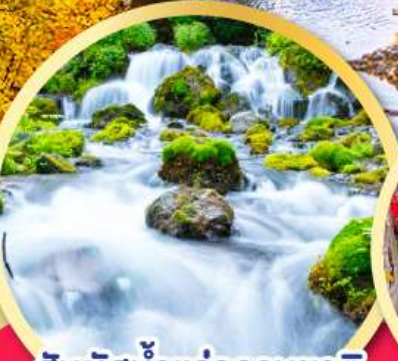
สัมผัสน้ำแร่ธรรมชาติ ณ สวนฟูทาคาชิ