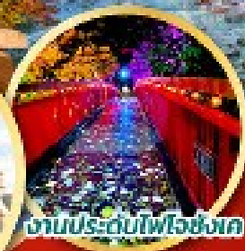
งานประดับไฟโงชิงก