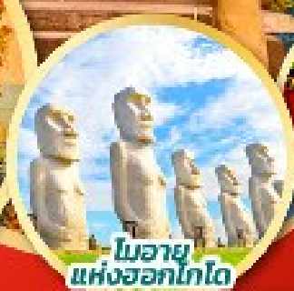
โมอาย แห่งออกโทโต