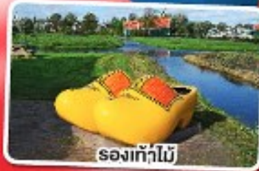
รองเท้าไม้