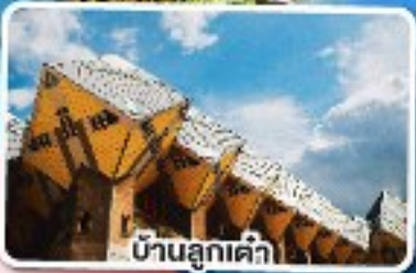
บ้านลูกเต้า