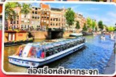
ล่องเรือหลังคากระจก