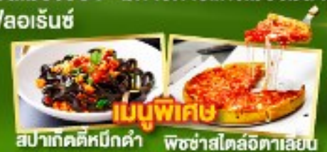
เมนูพิเศษ สปาเก็ตตี้หมักดำ พิชซ่าสโตล์อิตาลีเย็น