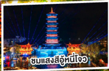
ชมแสงสีอุโมงค์ใจ