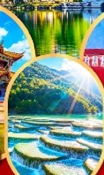
หุบเขาสีน้ำเงิน