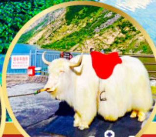
ทะเลสาปเตี้ยซี