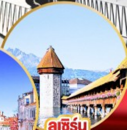
ลูซิิร์น