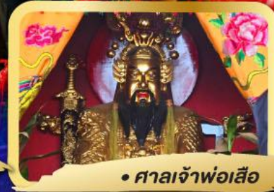
• ศาลเจ้าพ่อเสือ