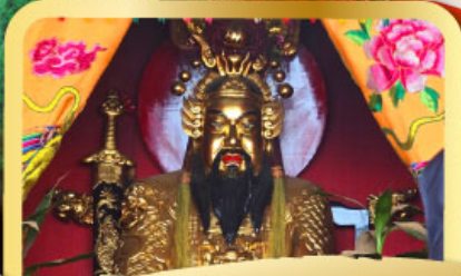
• ศาลเจ้าพ่อเสือ