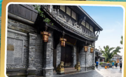
ถนนควานโจ๋เซียงจื่อ