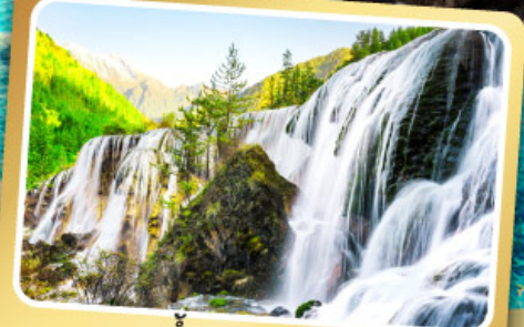
น้ำตกธารไข่มุก

ชมโชว์เปลี่ยนบุหน้ากาก เมนูพิเศษ สุกั๋หม่าล่าเสฉวน