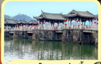
• สะพานโบราณกว่างจี