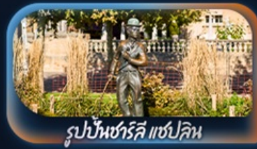
รูปปั้นชาร์ลี แชปลิน