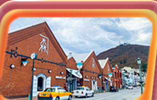
โค้งอิฐแดง

✈️ สายการบิน Thai Airways (TG) น้ำหนักกระเป๋า 23 KG