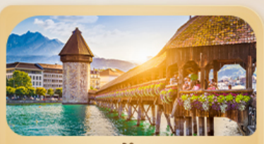
สะพานไม้ม้าเปลา

25 มี.ค. - 01 เม.ย. 69 / 04-11 เม.ย. 69 08-15 เม.ย. 69 / 28 เม.ย. - 05 พ.ค. 69 27 พ.ค. - 03 มิ.ย. 69