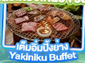
เติมอัมปิ้งย่าง Yakiniku Buffet